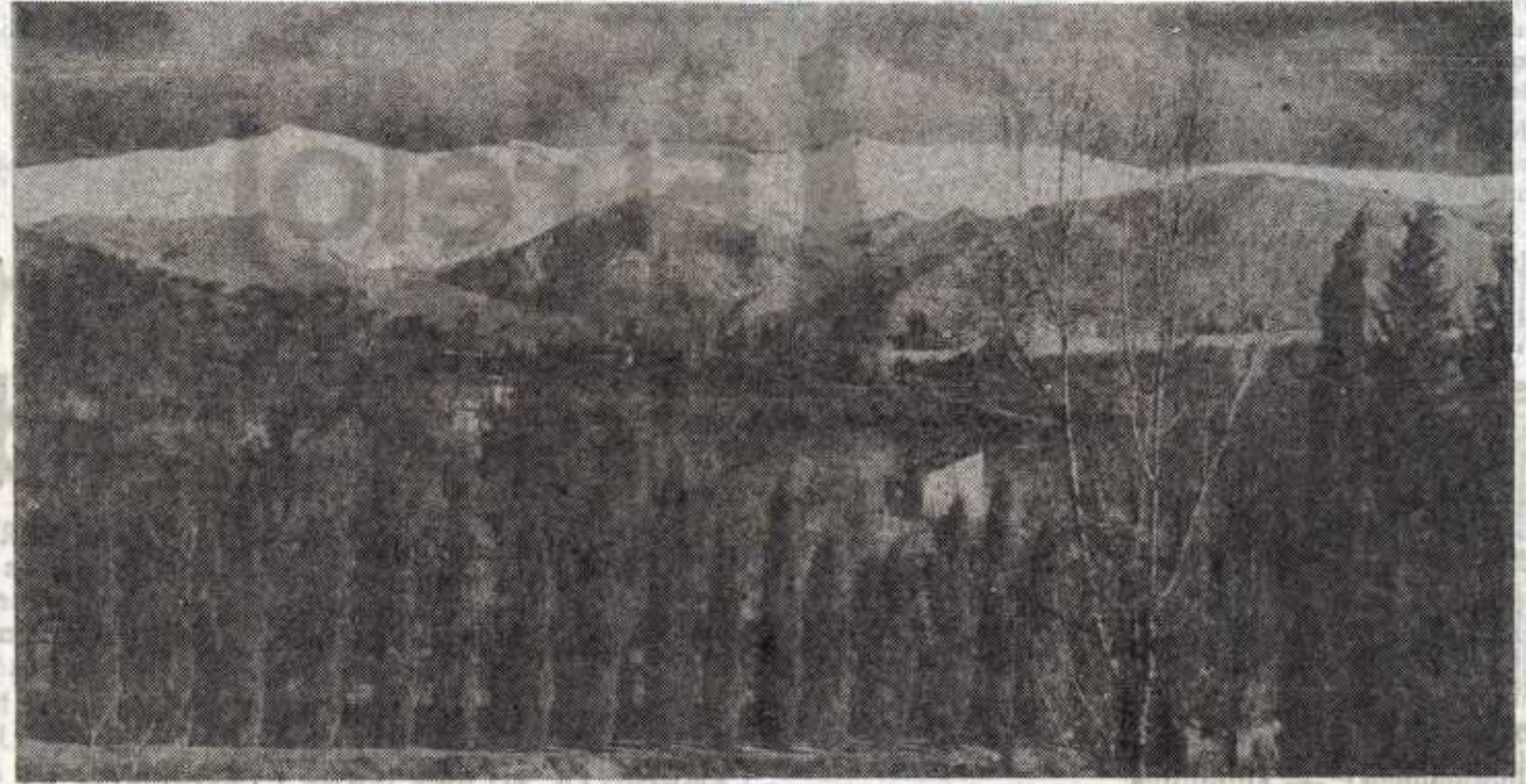
Típico paisaje que delata la variedad climática de Andalucía. Junto a una vegetación casi tropical, cumbres nevadas. En la provincia de Granada, basta una hora de coche (desde Motril a Sierra Nevada) para pasar del delirioso calor de la práctica de los deportes de invierno. He aquí un gran atractivo para el turismo, explotado puede intensificarse, enriqueciendo la región.