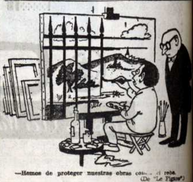
—Hemos de proteger nuestras obras contra el robo. (De "Le Figaro")