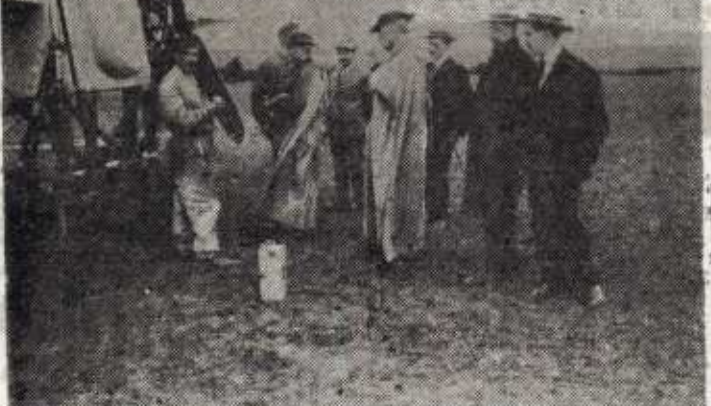
El día inaugural de la Escuela de Aviación en Vitoria. Junto al aparato, el aviador Garnier. A su lado, en el centro, el entonces nuncio de Su Santidad, delante del prelado vitoriano monseñor Cadena y Eleta, rodeados ambos de las autoridades alavesas y vitorianas.