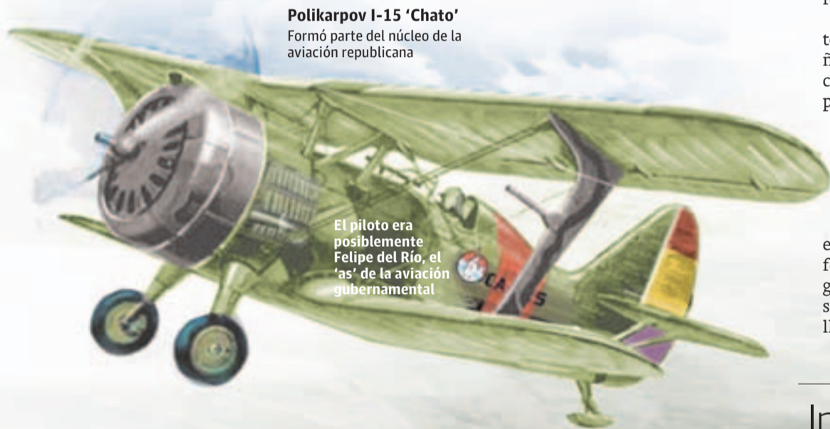
Polikarpov I-15 'Chato' Formó parte del núcleo de la aviación republicana

El piloto era posiblemente Felipe del Río, el 'as' de la aviación gubernamental