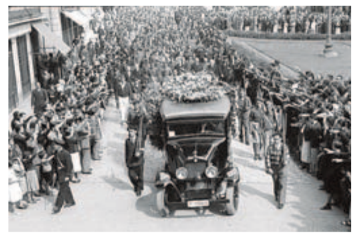
Accidente y funeral. El humo señala el lugar donde cayó el Heinkel a cuyo piloto se le hizo un gran funeral.

combate «un bimotor» rojo en un campo entre Yurre y Aránguiz. Sus tres tripulantes murieron. Un ruso, un inglés y un carabinero español. Era el Monospart ST-4 del británico Sidney Holland. Aún se estrellaría otro piloto italiano en octubre de 1937 en Mendiola. Sangre europea sobre los cielos de Vitoria.