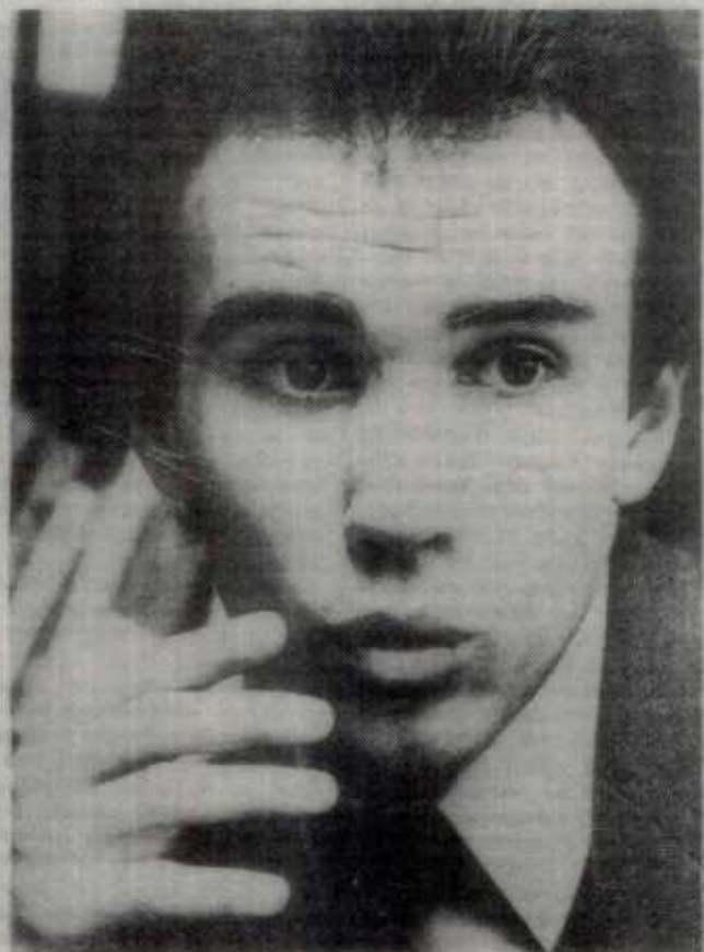
Para Francisco volar no debe ser cosa de millonarios, sino de quienes quieran y tengan ese sueño.

El planeador es un velero «Goavier» de estructura de madera y revestimiento de tela que fue el primero de su serie y el primero en volar tras la II Guerra Mundial. El autogiro es de origen francés.