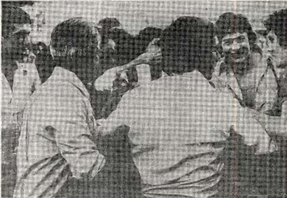
Los aficionados alaveses terminaron el encuentro de Las Gaunas, se lanzaron al campo para felicitar, abrazar, estrujar materialmente a los jugadores, uno de cuyos momentos recoge la escena.

Tranquilidad en el mundo «albiazul» después de los nervios de quince días pensando en la promoción, y después de 44 partidos todos ellos con más o menos «suspense», pues eso ha sido la Liga que acabamos de finalizar.