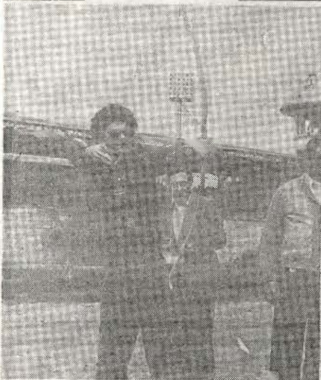
Una jornada más del tiro con arco. Un deporte que comienza y que quiere ir teniendo un puesto dentro del amplio abanico que se ofrece en nuestra provincia para practicar cualquier modalidad.

Acaba de comenzar esta actividad y los hay ya con ilusión y buen material para las pruebas. En las competiciones que se llevaron a cabo el pasado sábado los primeros puestos estuvieron de la forma siguiente: