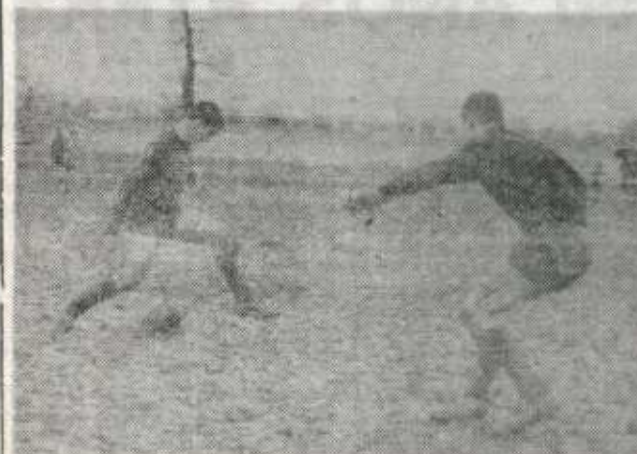
Como nos demuestra la foto, el anexo se encuentra así en muchísimos días de partido.