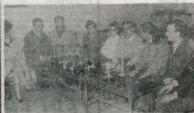
Directivos, entrenador y nadadores, reunidos en la última tarde de 1969, al objeto de celebrar la fiesta de Fin de Año, y efectuar la entrega de trofeos a los "vencedores de invierno".

Celebró el Club Natación Judizmendi su tradicional partido de fútbol fin de año, en el terreno de Educación y Descanso Partido, que hizo sirviera para pasar un buen rato entre los contendientes, dos bandos del mismo club, con veteranos por un lado y actuales por otro, que se midieron, teniendo un resultado de empate a un gol.