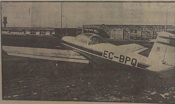
Este es el avión de enseñanza AISA 11-8, que ha tenido que "causar baja" a causa de las lluvias, por haberse deteriorado su superficie alar. El resto de los aviones no soportarán un invierno más a la intemperie.

Las peticiones cursadas ante la Diputación Foral de Alava han sido también presentadas ante la subsecretaría de Aviación Civil: Espacio dentro del aeropuerto para hangares de aviación general y construcción de uno similar al que ahora se está edificando para carga de mercancías y aduanas. Con una puntualización en este último aspecto: que el hangar pueda ser compartido con la variedad de aviones generales que pertenecen en Foronda.