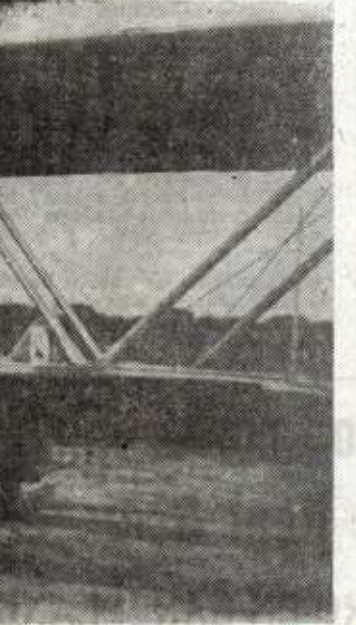
Un momento del festival aéreo, con el avión "Fiat" de Aresti, durante la campaña de Liberación.

El 5 de septiembre es un día grande: más de doscientas mil personas de Bilbao y la provin-