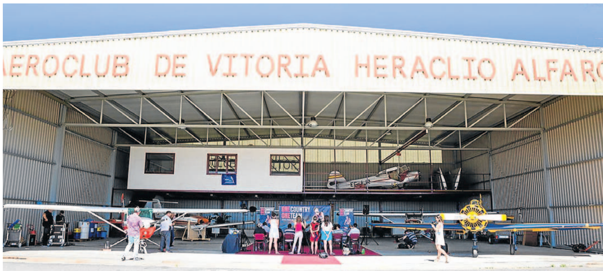
Imagen de la nave del Aeroclub Heraclio Alfaro, en Foronda, donde se celebró ayer la presentación de la campaña de abonados.