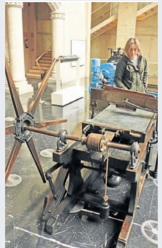
▲ Máquina. Una de las impresoras litográficas antiguas que fueron la gran novedad de la marca Fournier.