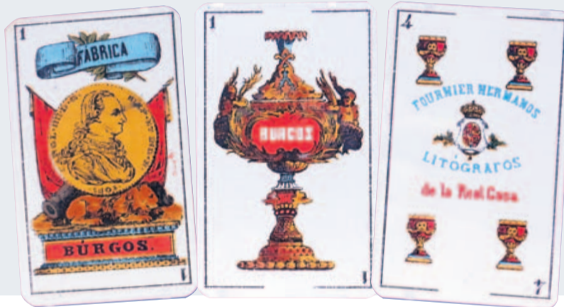
◀ De Burgos. Curiosa baraja que los Fournier fabricaban en su primera etapa.