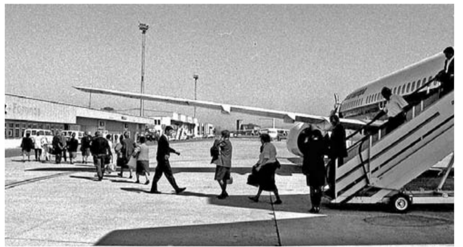
Primeros vuelos en el aeropuerto de Foronda.

bre de 1935. Toma el nombre de José Martínez de Aragón, un piloto alavés que realizó el primer 'looping' o giro vertical de 360 grados, que había impulsado el aeródromo y murió en un accidente de aviación poco antes de su puesta en marcha.