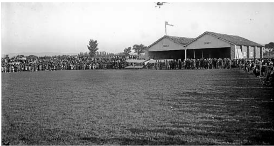
Otra imagen de la apertura de la escuela Garnier en Lakua.