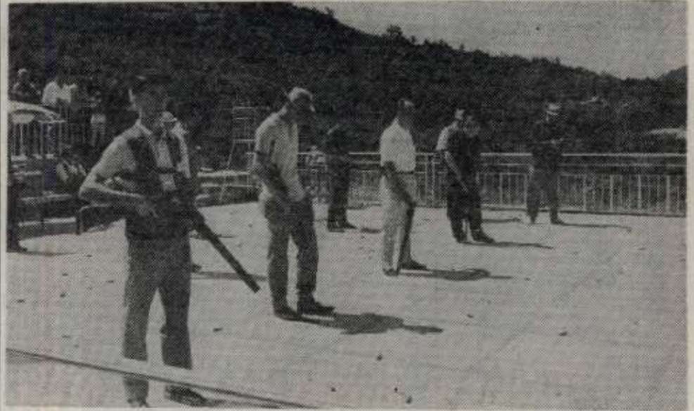
Cinco tiradores de las 38 escopetas que participaron en el "Gran Premio Aldayeta".